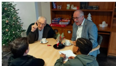
De kinderen interviewen een bewoner van de Symfonie.